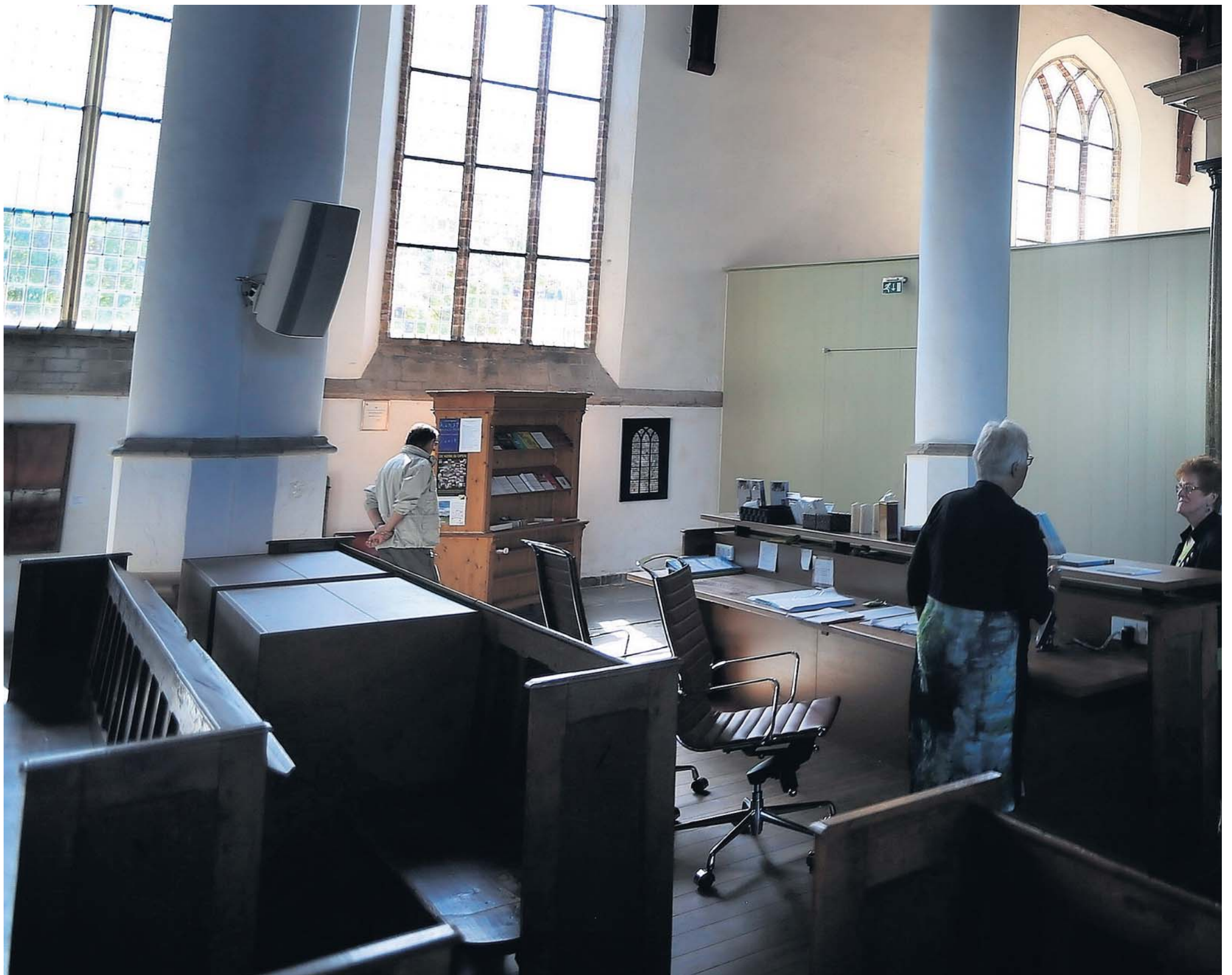
Kerkleden werpen een eerste blik in de verbouwde Martinikerk.